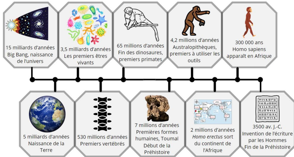
Document 1 : Le monde, du Big Bang à l'invention de l'écriture